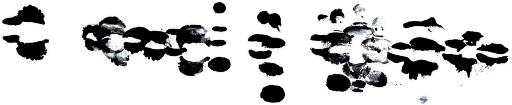
Lucrezia de Fazio No confies en nadie, 2020 Tinta sobre papel algodón 100 x 70 cm