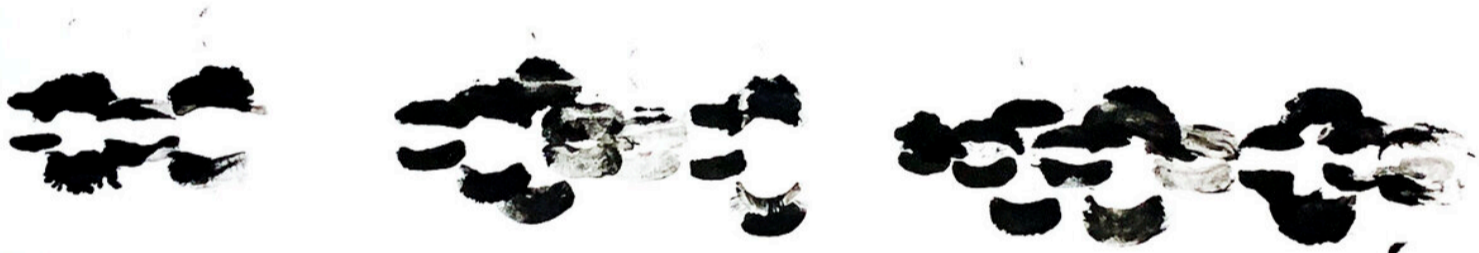
Lucrezia de Fazio Huye cuando puedas, 2020 Tinta sobre papel algodón 100 x 70 cm